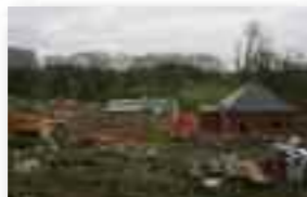
Construction de la station d'épuration d'Orp-le-Grand (IBW)