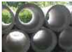
Pose du collecteur d'eaux usées (IBW)