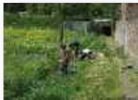
Ecotravaux sur le Ry Cati (Conservatoire Naturel d'Orp-Jauche + CRABE)