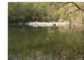
Réserve naturelle du Paradis (Conservatoire Naturel d'Orp-Jauche)