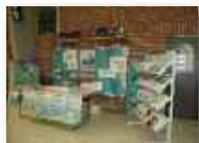
Exposition du Contrat de rivière (La Petite Jauce + CR Dyle-Gette)