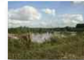
Bassin d'orage de Marilles