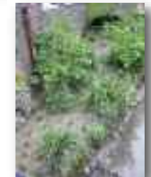
Banquette d'atterrissement sur la Petite Gette