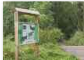
Panneau « La Jaucière » le long du RAVeL (La Petite Jauce + CR Dyle-Gette)