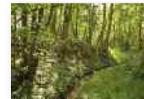
Ruisseau du Village à Nodreng