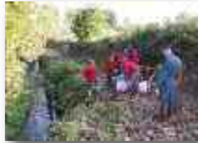
Opération « rivières propres » (Commune + Le Pêcheur Gethois + Unité St-Martin)