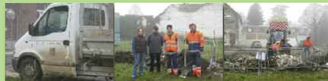
Opération de nettoyage des dépôts de déchets le long des cours d'eau, novembre 2010

Une collaboration fructueuse de tous les citoyens est nécessaire pour améliorer la qualité de nos rivières. Nous faisons appel à vous afin de participer aux futures initiatives qui seront prises dans le cadre du Contrat de rivière .