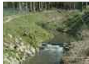
Aménagement de cascadelles sur le Henry Fontaine (SPW)