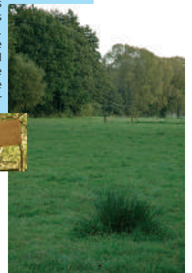
Le Pisselet traverse de nombreuses prairies inondées à Dion-Valmont

Le parcours du Pisselet est jalonné par différents sites naturels dont le fond de la vallée bordé par des prairies et plusieurs zones humides, à Dion-le-Mont. En tête de la vallée du Ruisseau de Louvrance, le Bois de Villers, constitue également un site naturel très riche. Il est composé de vieille futaie mélangée de hêtres avec sous-bois de muguet, fougère-aigle et myrtille, représentative de la forêt primitive sur sables bruxelliens.