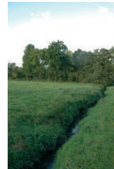
Le Ruisseau de Louvrance à Dion-Valmont