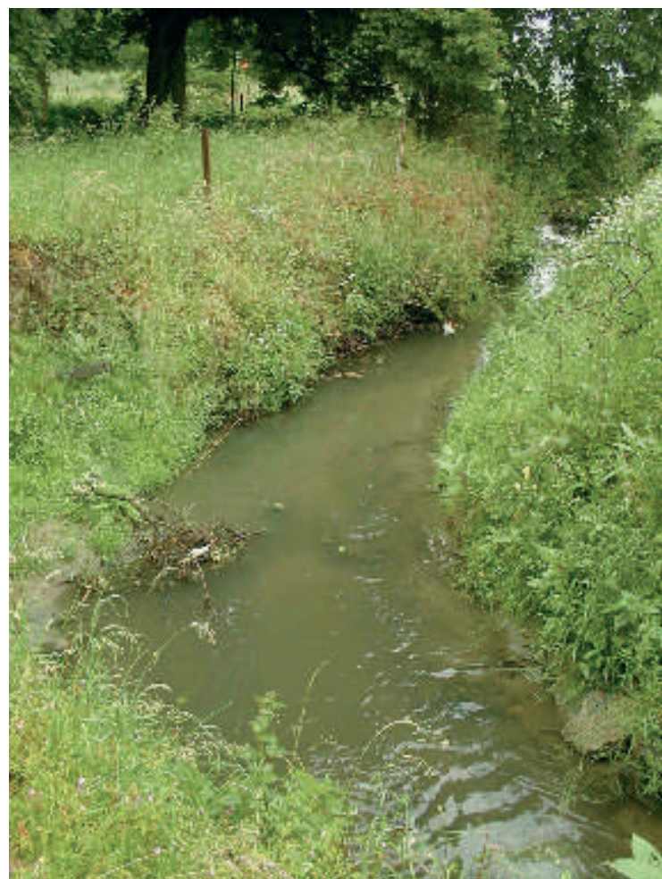
Le Pisselet à Dion-Valmont

Le projet de Contrat de rivière Dyle , lancé au lendemain de la conférence internationale de Rio sur le développement durable, a été initié par 25 associations du Brabant wallon. Le 24 avril 1998, ce ne sont pas moins de 47 partenaires , publics (dont 14 communes du bassin versant de la Dyle) et privés, qui ont ratifié le Contrat de rivière Dyle et affluents. Ce contrat aborde, au travers de son programme, 18 thèmes différents, déclinés en 76 actions . Le Contrat de rivière agit également auprès des agriculteurs et entreprises de manière à rencontrer l'ensemble de ses objectifs.