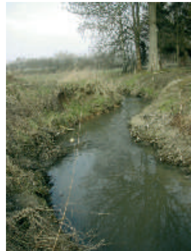
Le Pisselet avant qu'il ne se jette dans la Dyle, à Gastuche