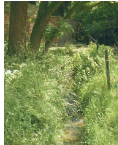
Le Pisselet amont, à Vieusart