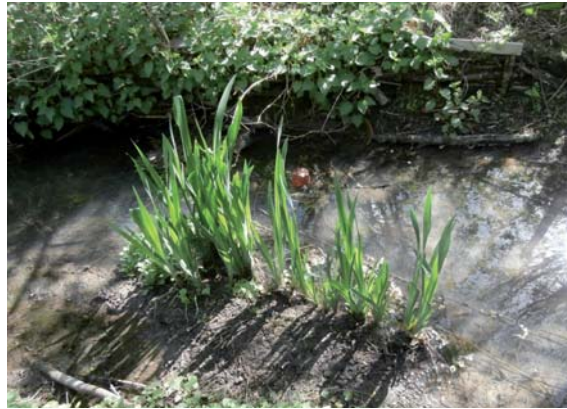
Lit d'un cours d'eau colmaté

De plus, les fonds vaseux où s'accumulent des dépôts de matière organique sont caractérisés par un manque fréquent d'oxygène entraînant la réduction des populations d'invertébrés aquatiques à la base du régime alimentaire des poissons. Toute la chaîne alimentaire s'en trouve fragilisé.