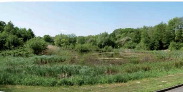
Richesse biologique des zones humides (Renipont)