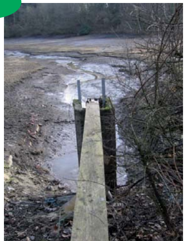
Vidange d'étang - Lasne

Cette étape permet aussi de limiter la prolifération d'espèces indésirables et d'assainir les vases en interrompant le cycle biologique de certains organismes pathogènes préjudiciables.