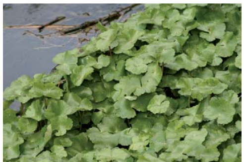
Hydrocotyle fausse renoncule