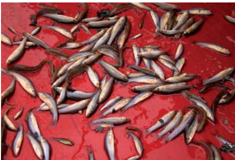
Grande abondance de goujons asiatiques lors d'une vidange d'étang

Des espèces piscicoles indésirables peuvent également être introduites dans le cours d'eau : espèces exotiques nuisibles, espèces d'élevage non indigènes. Il en va de même pour les espèces exotiques d'écrevisses, porteuses d'un champignon très contagieux qui provoque la mort de nos écrevisses indigènes. (infos complémentaires sur les espèces invasives : biodiversite.wallonie.be et alterias.be ).