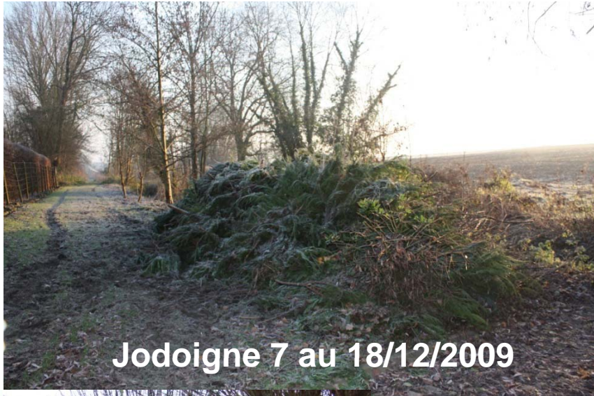
Jodoigne 7 au 18/12/2009