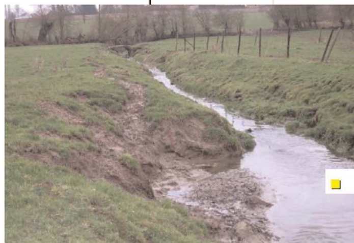
■ Erosions prioritaires