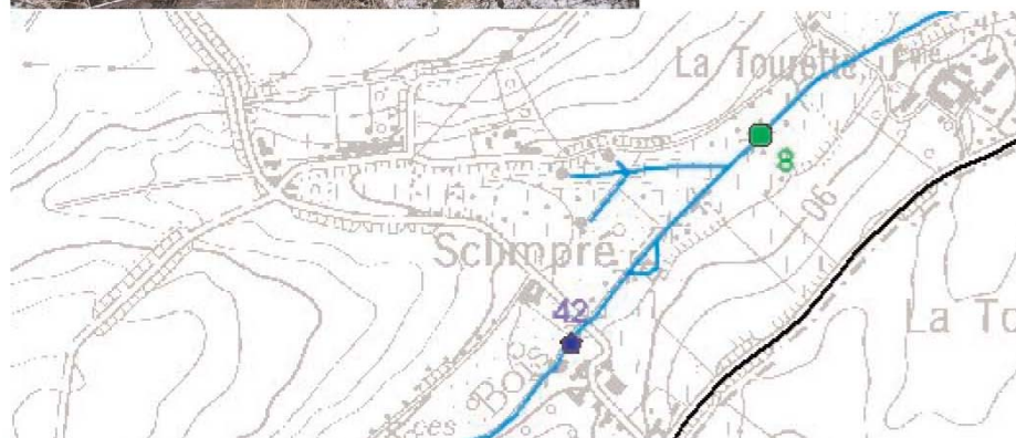
Carte N° 28