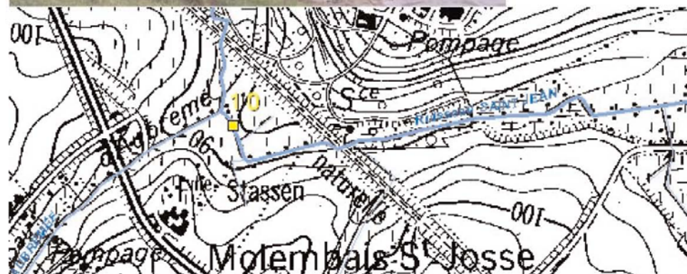
Carte N° 21 bis