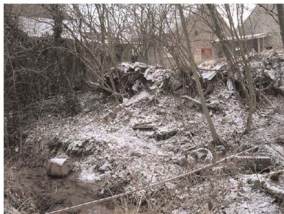
◆ Déchets prioritaires